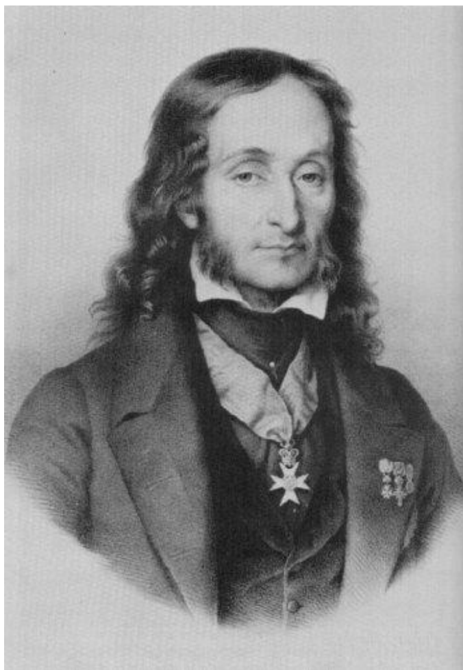
Никколо Паганини в возрасте 32 лет 1814 г.