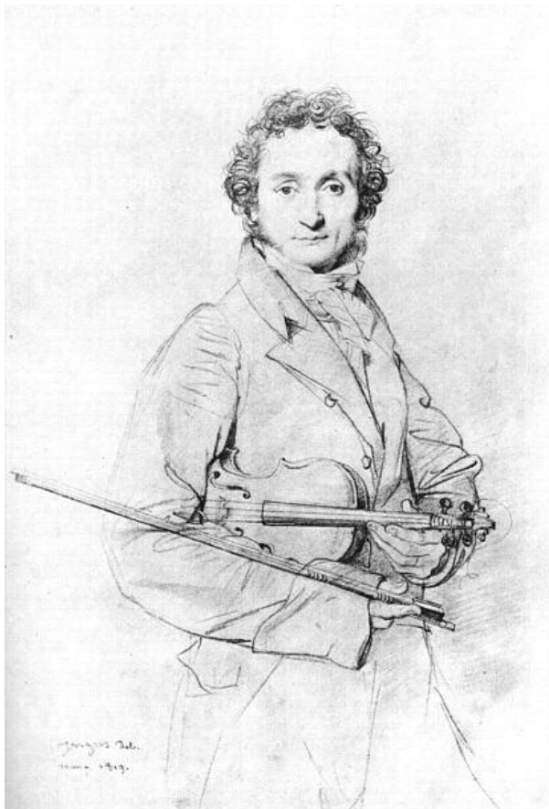
Жан-Огюст-Доминик Энгр Портрет Паганини 1819 г.