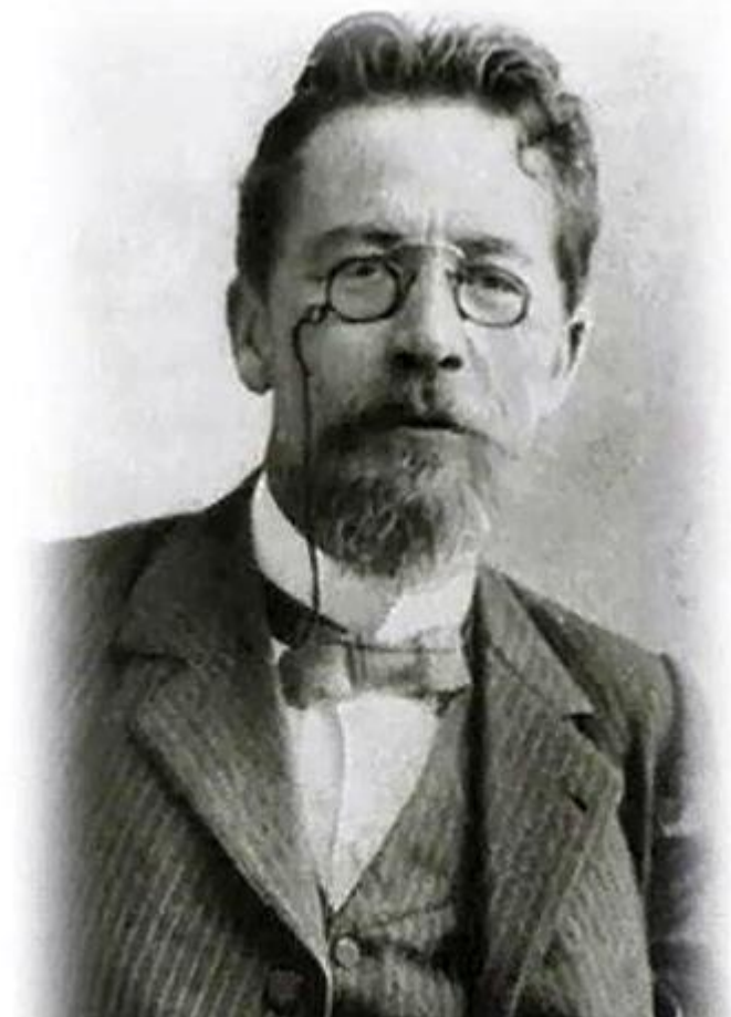
Антон Павлович Чехов(1860-1904гг.)

Всем известно, что Чехов болел туберкулезом, но знал ли он о своем заболевании?